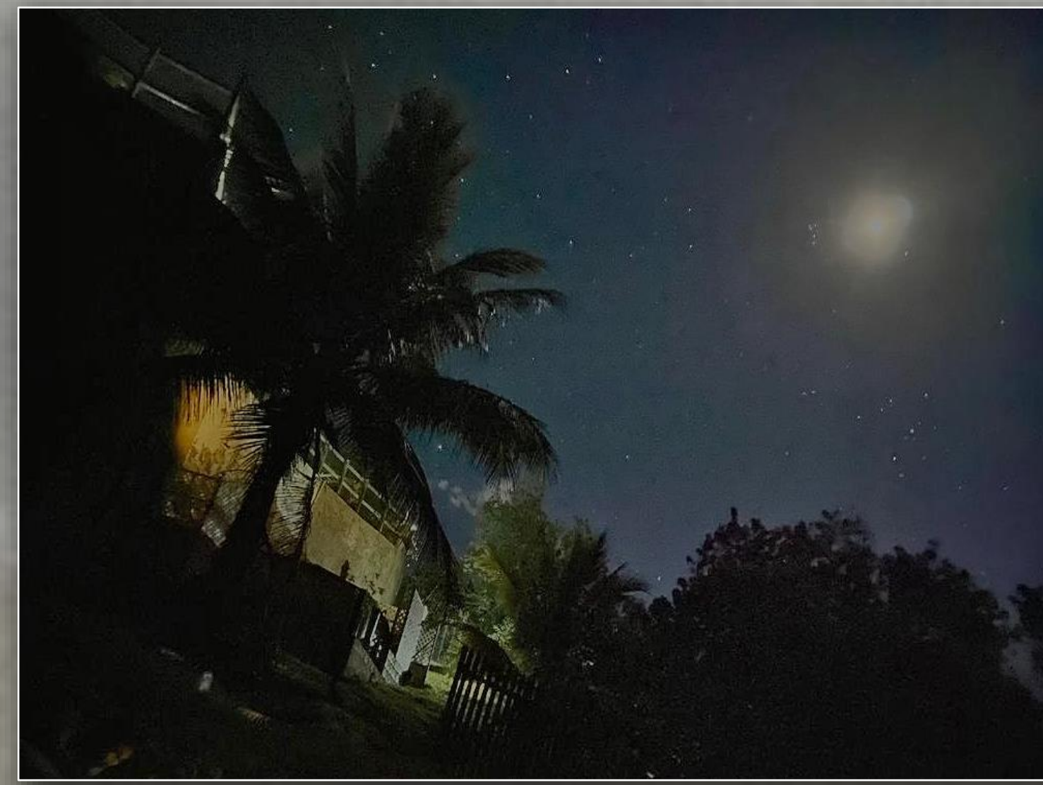
Figura 1: Casas a lo largo de la costa de Jamaica con luces destinadas a iluminar la propiedad también iluminan la playa. Esto puede hacer que las crías recién nacidas se desorienten hacia la tierra.